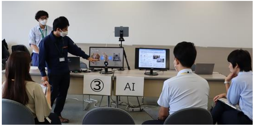
AIによる映像解析の説明