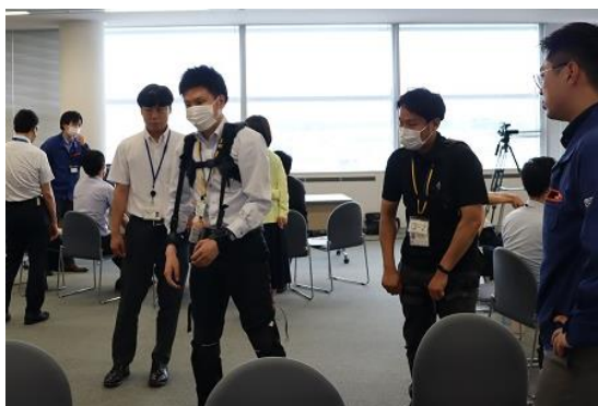
アシストスーツの着用体験