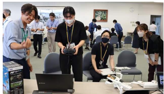
ドローンシミュレータの操作体験